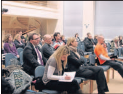
Etwa 60 Zuhörer und Diskussteilnehmer waren zum Thema Kita-Finanzien in die Aula der Theodor-Mommsen-Schule gekommen.

zes Gehalt dafür einbringen müssten, ihre beiden Kinder an frühkindlicher Bildung teilhaben zu lassen. Bürgermeister Sarah betonte, dass man zwar ein außerordentliches Interesse an der Förderung der Kinder habe, auch die Stadt Ahrensburg aber an ihre Grenzen stoße. Dort müssten insgesamt 285 neue Betreuungsplätze geschaffen werden. Sachs nannte die derzeitigen Zustände „für alle unerträglich“, ein „Kuddelmuddel“, das es in keinem anderen Zuwendungsbereich gebe und dass keine Planungssicherheit erlaube. Dagegen würden Notrufe in den Einrichtungen immer lauter: „Wir wissen nicht mehr weiter!“ Von einer Verbesserung der Qualität in den Kitas sei schon längst nicht mehr die Rede. Er wäre ja bereits froh über einen Qualitätserhalt. Und setzte gleich noch eins drauf: „Die Eltern müssten demnächst wohl eher noch mehr als weniger zahlen.“